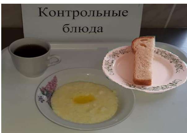
Завтрак для учащихся, питающихся за счёт родительского взноса