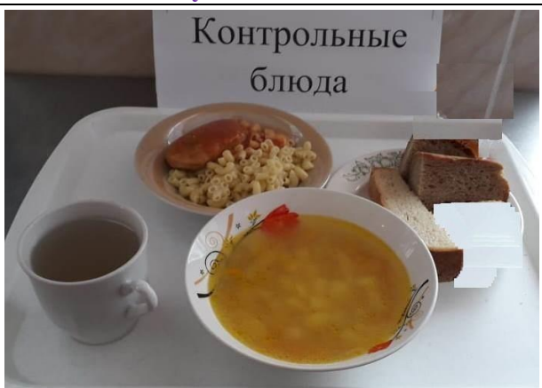
Обед для учащихся 1-4 кл. с ОВЗ