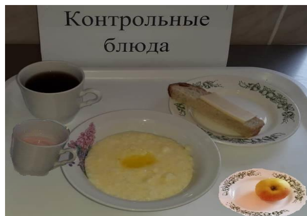
Завтрак для учащихся с ОВЗ