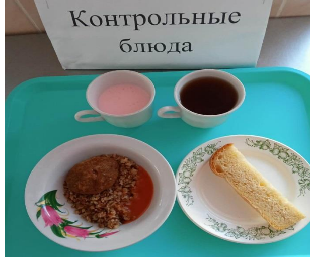
Завтрак для учащихся из многодетных семей