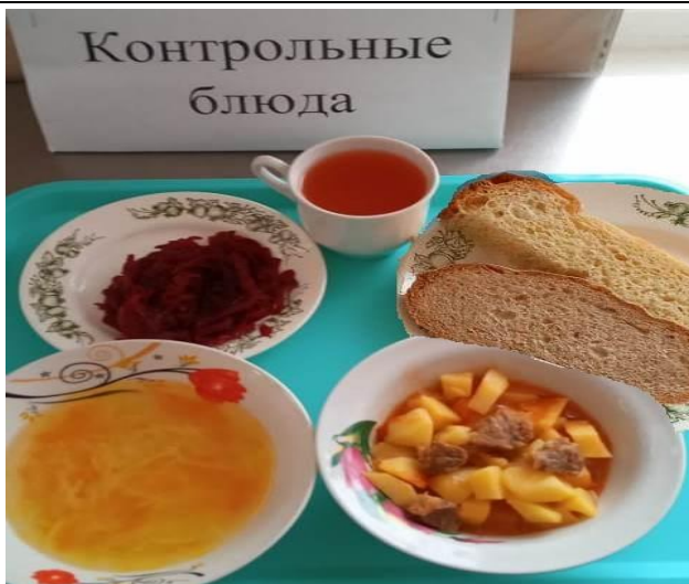
Обед для учащихся 1-4 кл. с ОВЗ