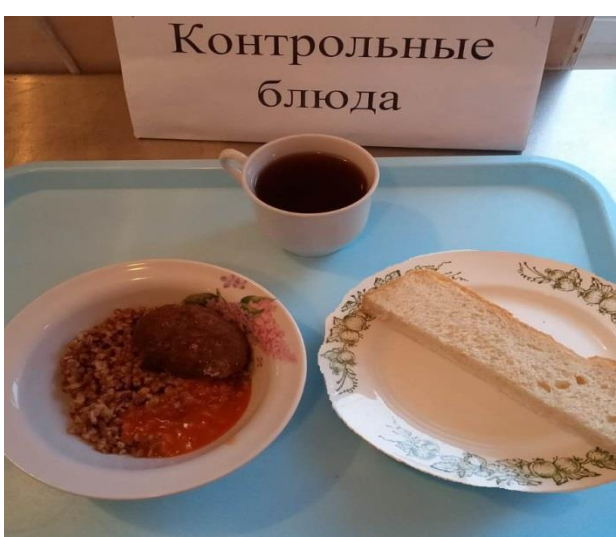
Завтрак для учащихся, питающихся за счёт родительского взноса