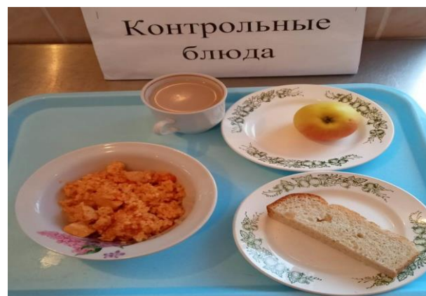
Завтрак для учащихся 1-4 кл.