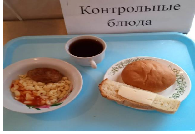
Завтрак для учащихся из многодетных семей