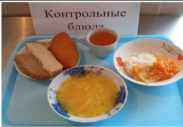
Обед для учащихся 1-4 кл. с ОВЗ