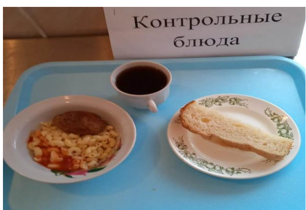
Завтрак для учащихся, питающихся за счёт родительского взноса