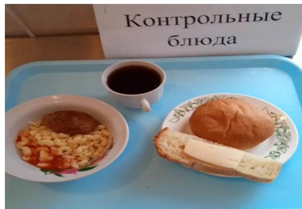
Завтрак для учащихся с ОВЗ