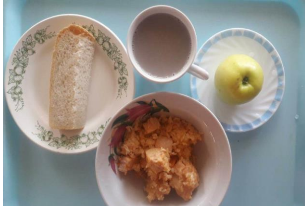
Завтрак для учащихся из многодетных семей