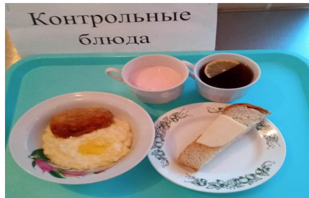
Завтрак для учащихся с ОВЗ