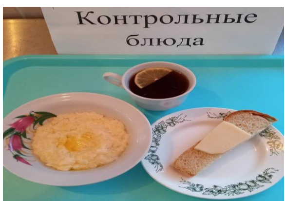
Завтрак для учащихся, питающихся за счёт родительского взноса