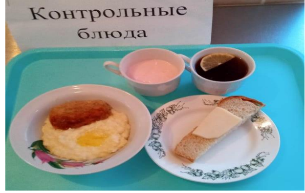
Завтрак для учащихся из многодетных семей