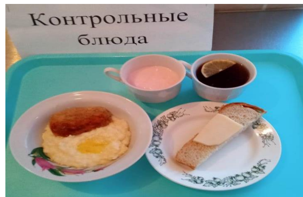
Завтрак для учащихся 1-4 кл.