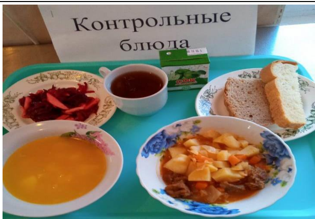
Обед для учащихся 1-4 кл. с ОВЗ