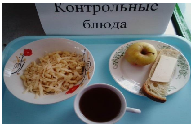
Завтрак для учащихся 1-4 кл.