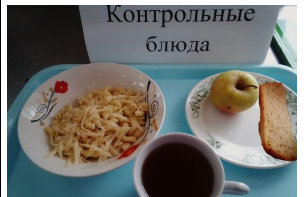
Завтрак для учащихся, питающихся за счёт родительского взноса