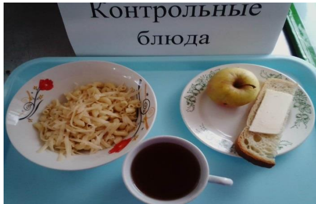
Завтрак для учащихся с ОВЗ