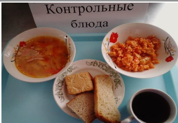
Обед для учащихся 1-4 кл. с ОВЗ