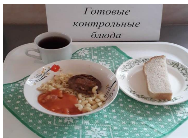
Завтрак для учащихся, питающихся за счёт родительского взноса