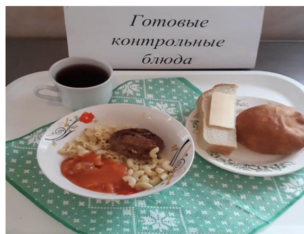
Завтрак для учащихся 1-4 кл.