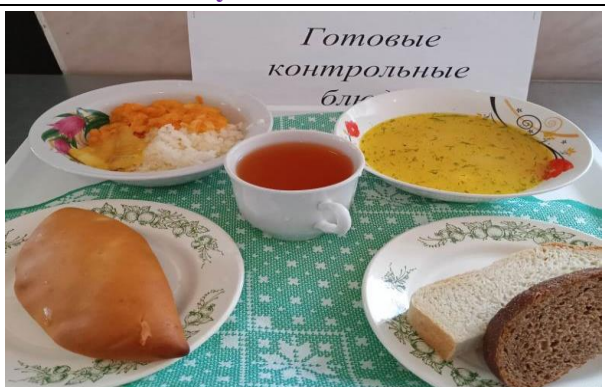
Обед для учащихся 1-4 кл. с ОВЗ