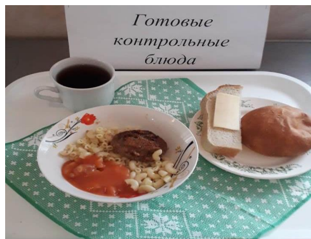
Завтрак для учащихся с ОВЗ