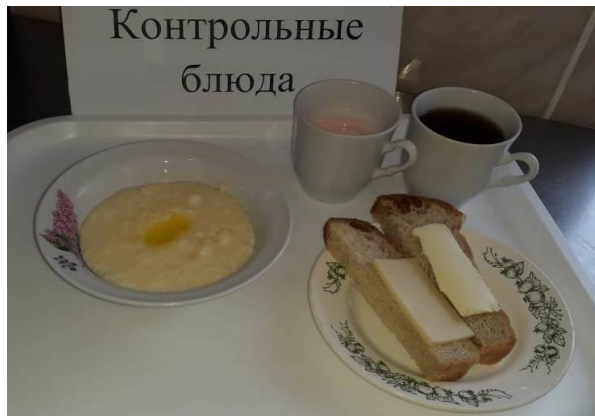
Завтрак для учащихся 1-4 кл.