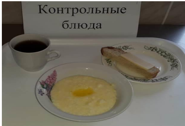
Завтрак для учащихся с ОВЗ