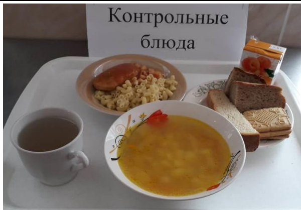
Обед для учащихся 1-4 кл. с ОВЗ