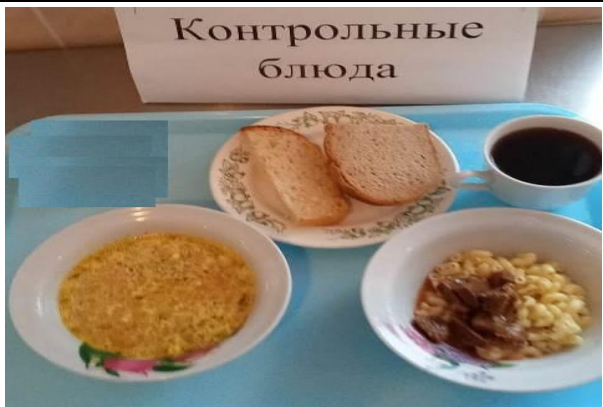
Обед для учащихся 1-4 кл. с ОВЗ