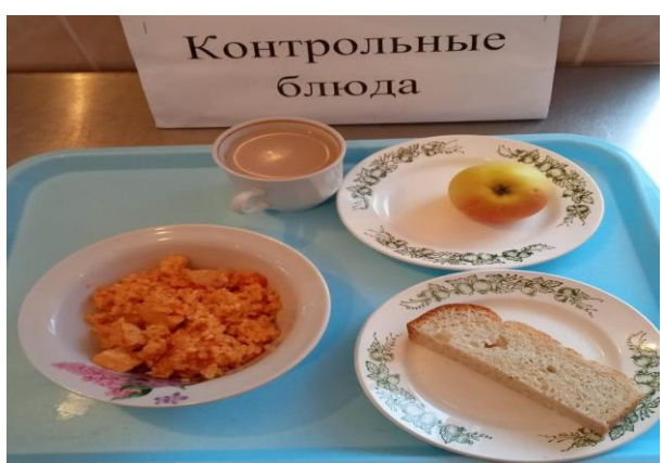
Завтрак для учащихся, питающихся за счёт родительского взноса