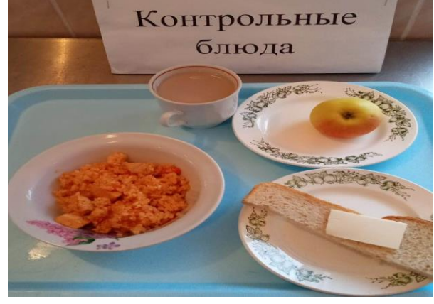
Завтрак для учащихся из многодетных семей