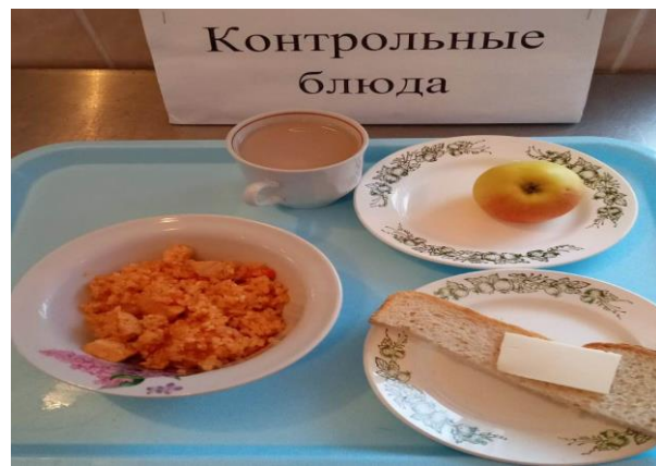
Завтрак для учащихся с ОВЗ