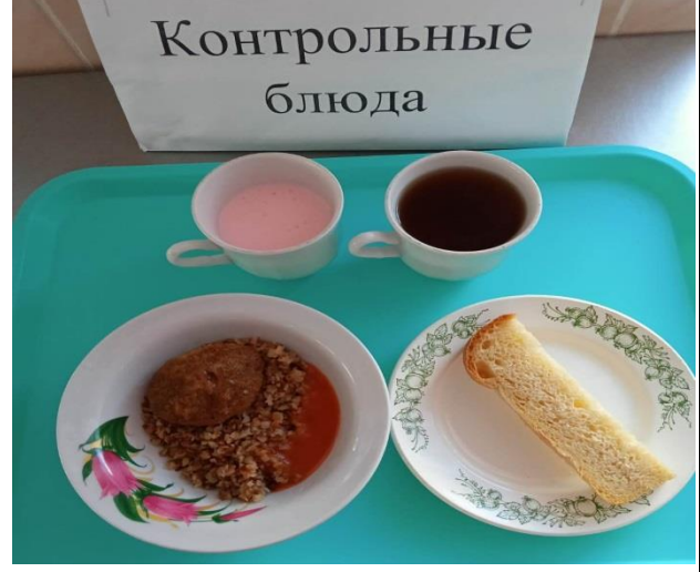
Завтрак для учащихся, питающихся за счёт родительского взноса