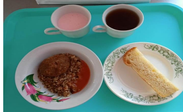
Обед для учащихся 1-4 кл. с ОВЗ