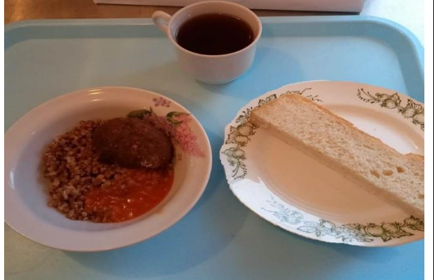
Обед для учащихся 5-11 кл. с ОВЗ