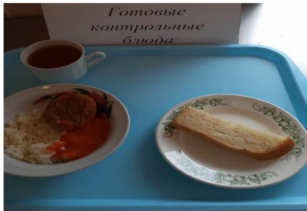
Завтрак для учащихся 1-4 кл.