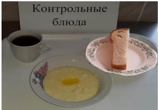
Завтрак для учащихся, питающихся за счёт родительского взноса