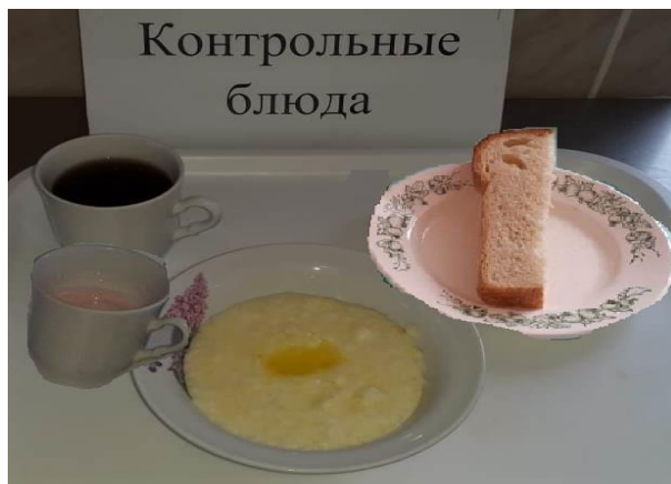
Завтрак для учащихся 1-4 кл.