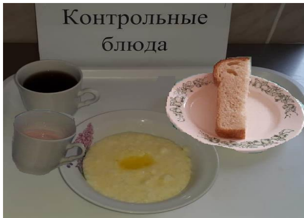
Завтрак для учащихся с ОВЗ