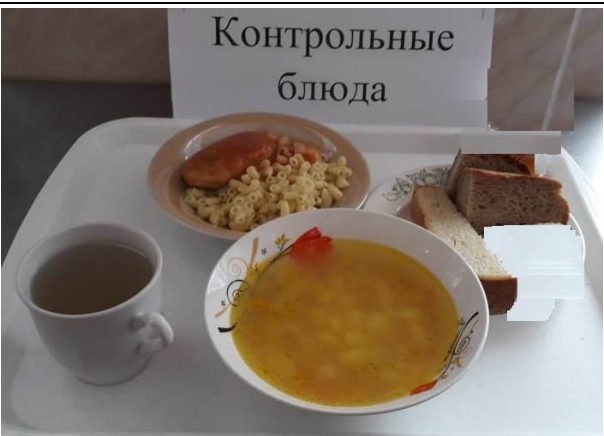
Обед для учащихся 1-4 кл. с ОВЗ