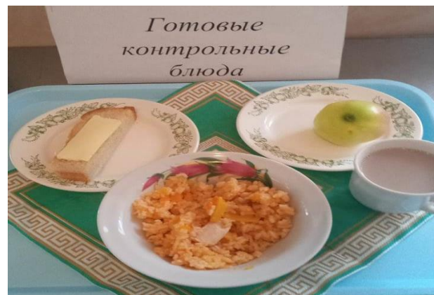
Завтрак для учащихся 1-4 кл.