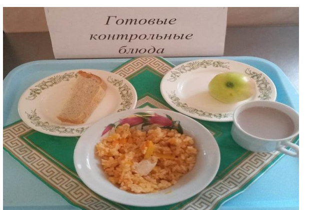
Завтрак для учащихся, питающихся за счёт родительского взноса