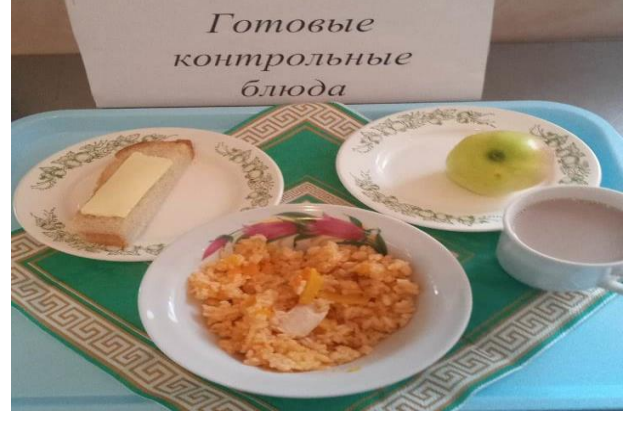
Завтрак для учащихся из многодетных семей