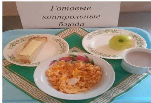
Завтрак для учащихся с ОВЗ