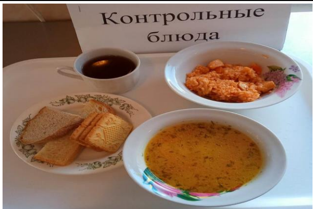
Обед для учащихся 1-4 кл. с ОВЗ