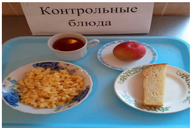
Завтрак для учащихся, питающихся за счёт родительского взноса