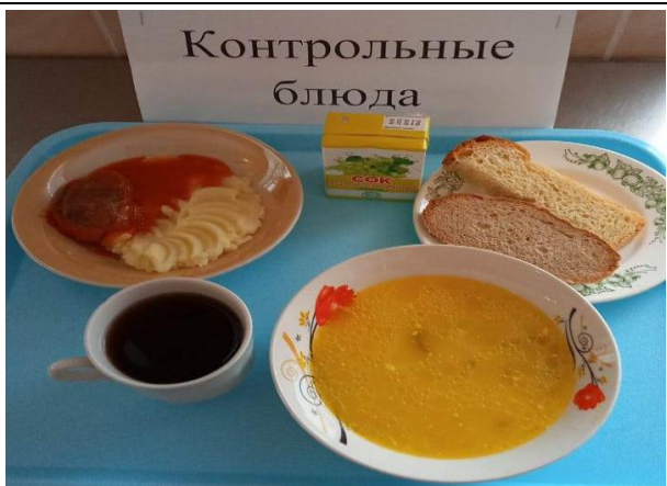
Обед для учащихся 1-4 кл. с ОВЗ