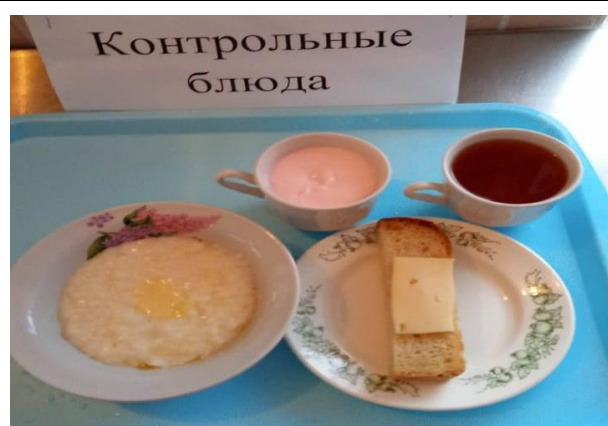
Завтрак для учащихся с ОВЗ