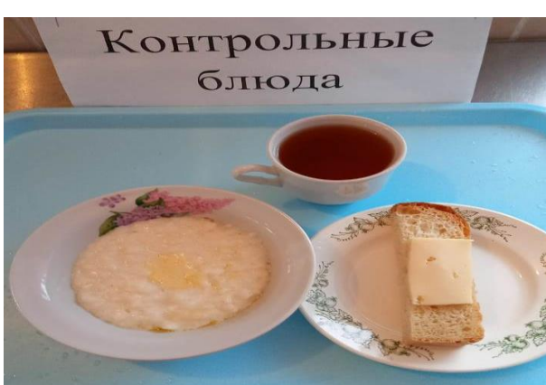
Завтрак для учащихся, питающихся за счёт родительского взноса