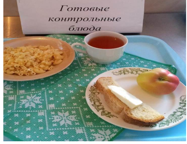
Завтрак для учащихся из многодетных семей