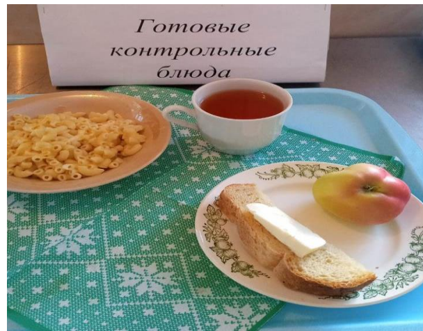
Завтрак для учащихся с ОВЗ