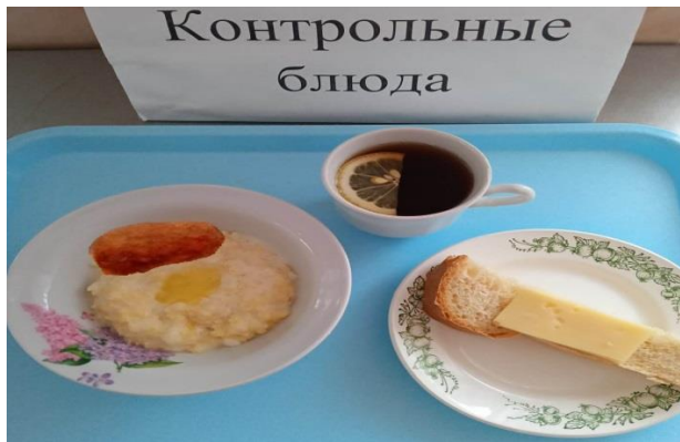
Завтрак для учащихся с ОВЗ