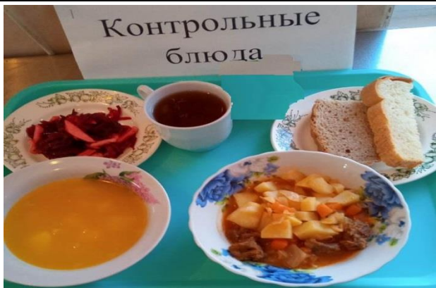
Обед для учащихся 1-4 кл. с ОВЗ