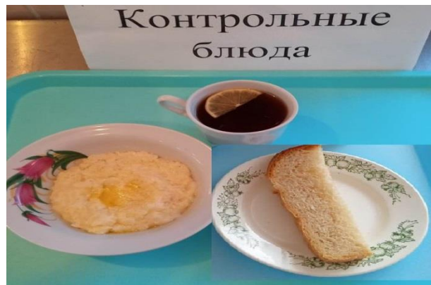
Завтрак для учащихся, питающихся за счёт родительского взноса