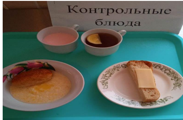
Завтрак для учащихся из многодетных семей