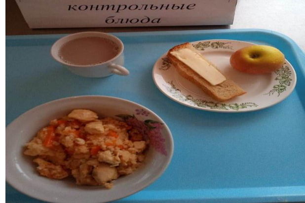
Завтрак для учащихся из многодетных семей