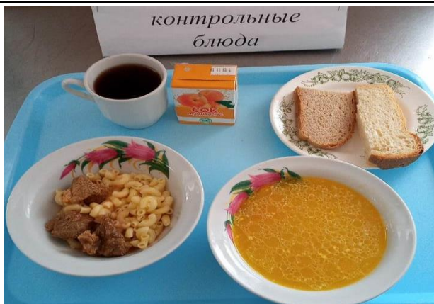
Обед для учащихся 1-4 кл. с ОВЗ