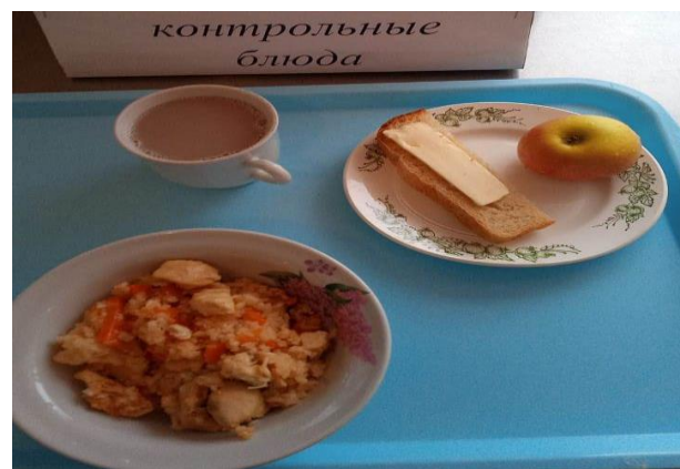
Завтрак для учащихся 1-4 кл.