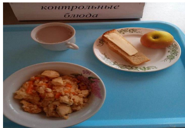
Завтрак для учащихся с ОВЗ