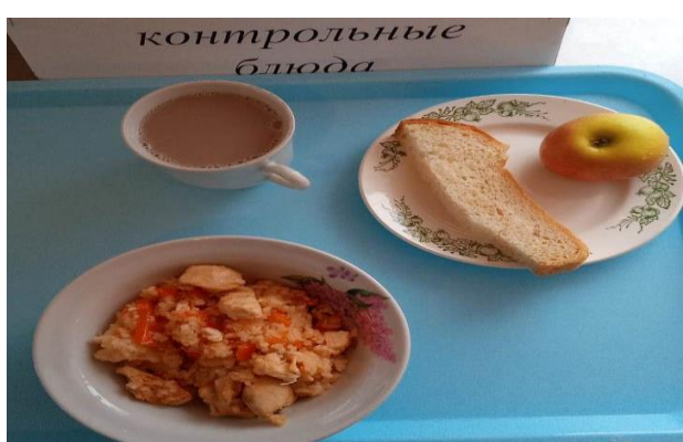
Завтрак для учащихся, питающихся за счёт родительского взноса