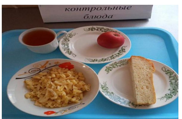
Завтрак для учащихся, питающихся за счёт родительского взноса