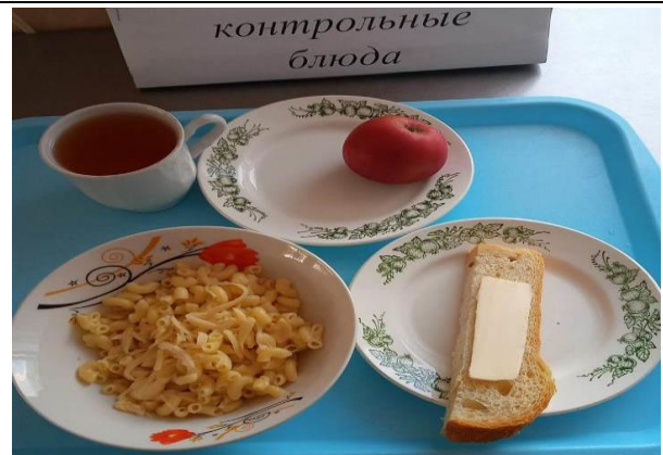
Завтрак для учащихся из многодетных семей