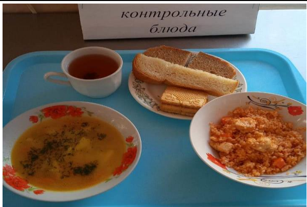
Обед для учащихся 1-4 кл. с ОВЗ