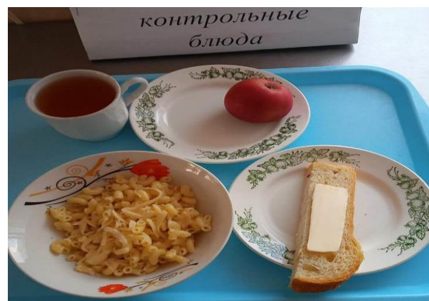
Завтрак для учащихся 1-4 кл.