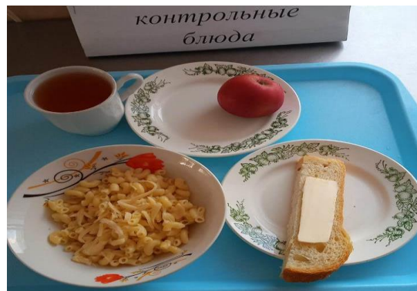
Завтрак для учащихся с ОВЗ