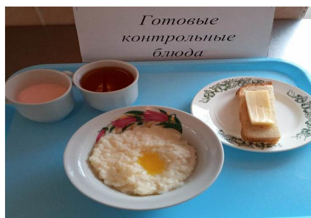
Завтрак для учащихся с ОВЗ