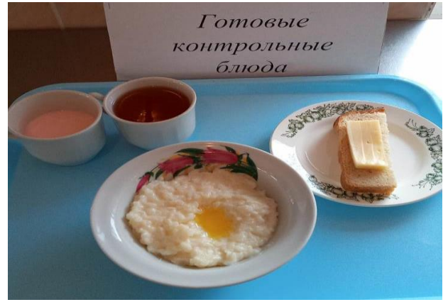
Завтрак для учащихся из многодетных семей