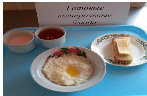
Завтрак для учащихся 1-4 кл.