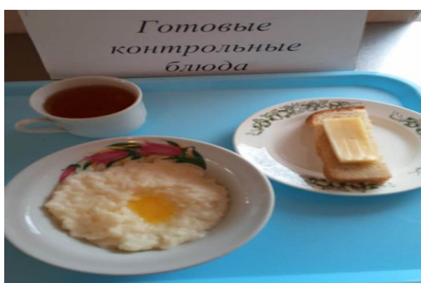
Завтрак для учащихся, питающихся за счёт родительского взноса