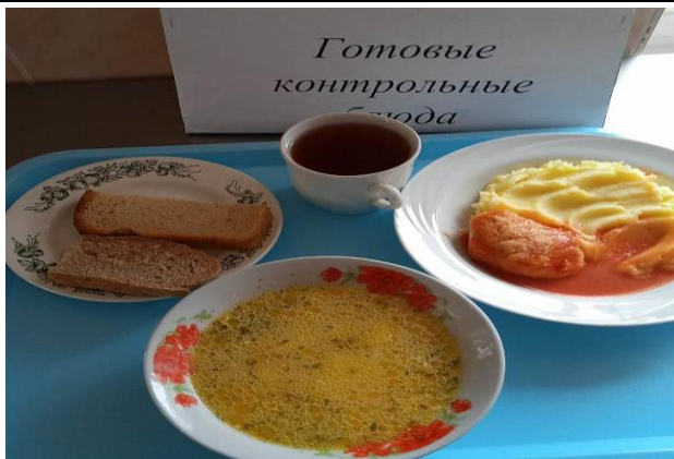
Обед для учащихся 1-4 кл. с ОВЗ