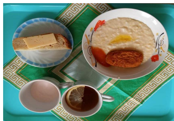
Завтрак для учащихся 1-4 кл.