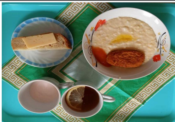
Завтрак для учащихся из многодетных семей