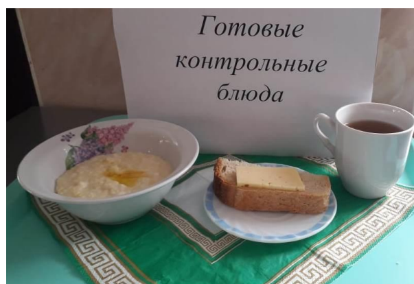
Завтрак для учащихся, питающихся за счёт родительского взноса