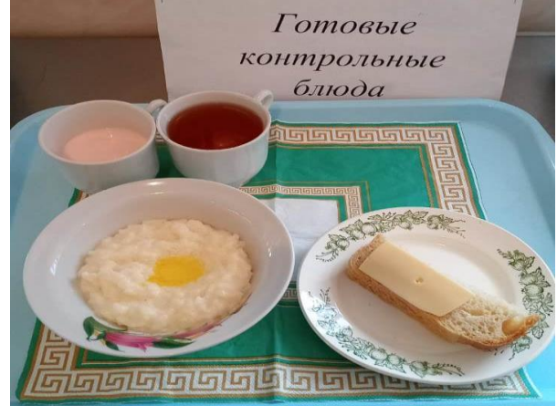
Завтрак для учащихся из многодетных семей