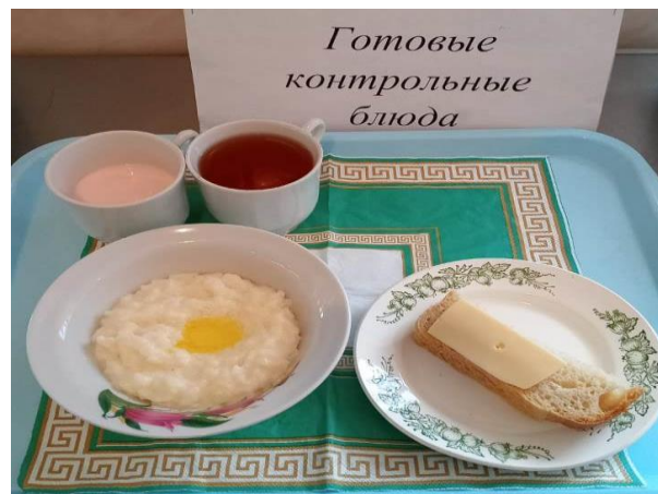
Завтрак для учащихся с ОВЗ