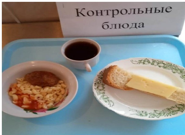
Завтрак для учащихся с ОВЗ