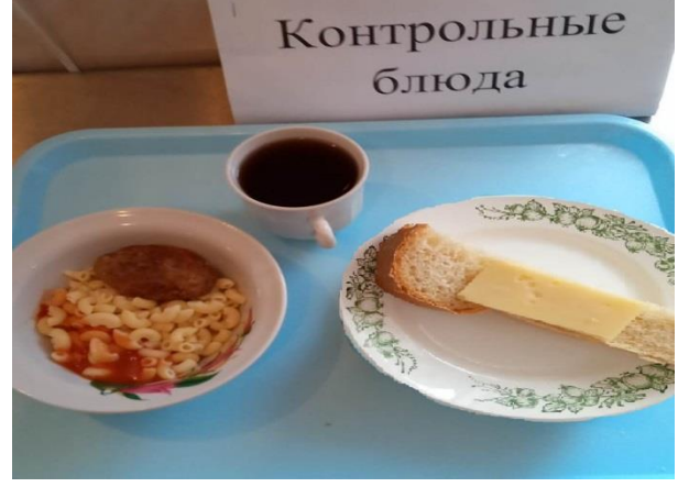
Завтрак для учащихся из многодетных семей