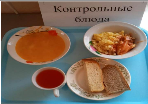
Обед для учащихся 1-4 кл. с ОВЗ