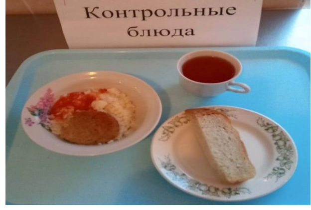
Завтрак для учащихся из многодетных семей